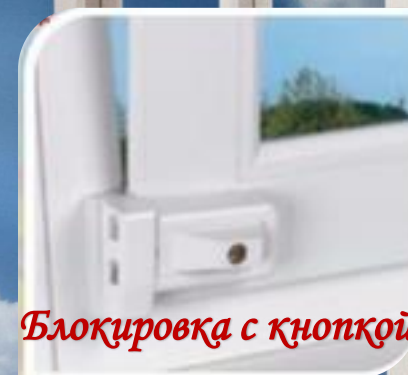
Блокировка с кнопкой