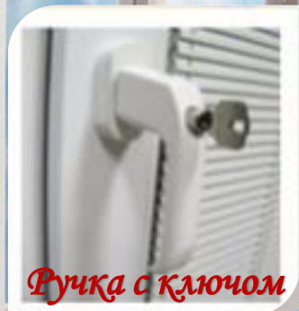
Ручка с ключом

Это обойдется дороже, зато будет выглядеть более эстетично